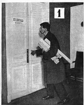
ДВЕРИ ДОЛЖНЫ РАСПЯХИТЬСЯ!

Первый номер журнала «ИЗОБРЕТАТЕЛЬ» открывает статья Альберта Эйнштейна «Массы вместо единиц», где великий ученый говорит, что время гениальных изобретателей-одиночек прошло, наступает замечательная эпоха коллективного изобретательства. В этой январской книжке новорожденного издания блистательный подбор авторов. Со статьями выступают крупные государственные и партийные деятели — В.Куйбышев, Л.Каменев, замечательные писатели — М.Пришвин, В.Шкловский, Н.Погодин, знаменитый журналист М.Кольцов, академики, выдающиеся инженеры и простые рабочие. Печатается бюллетень важнейших государственных решений по изобретательским делам, в том числе о привилегиях, помогавших тогдашним изобретателям жить и заниматься творчеством.